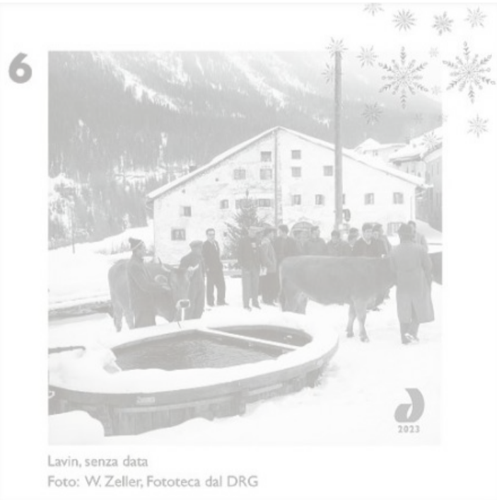
Lavin, senza data

Il fotograf e schurnalist liber Willy Zeller (1900–1978) ha deditgà ina buna part da sia lavur als quitads e duairs dals purs da muntogna. Quai sa reflectescha er en questa fotografia che mussa ils participants dad in curs per stimar muaglia a Lavin en Engiadina.