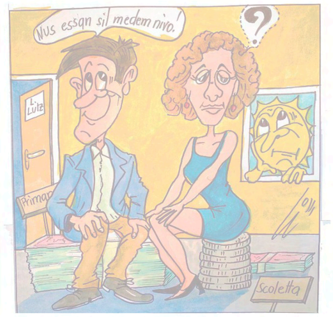
CARICATURA LINUS FLEPP